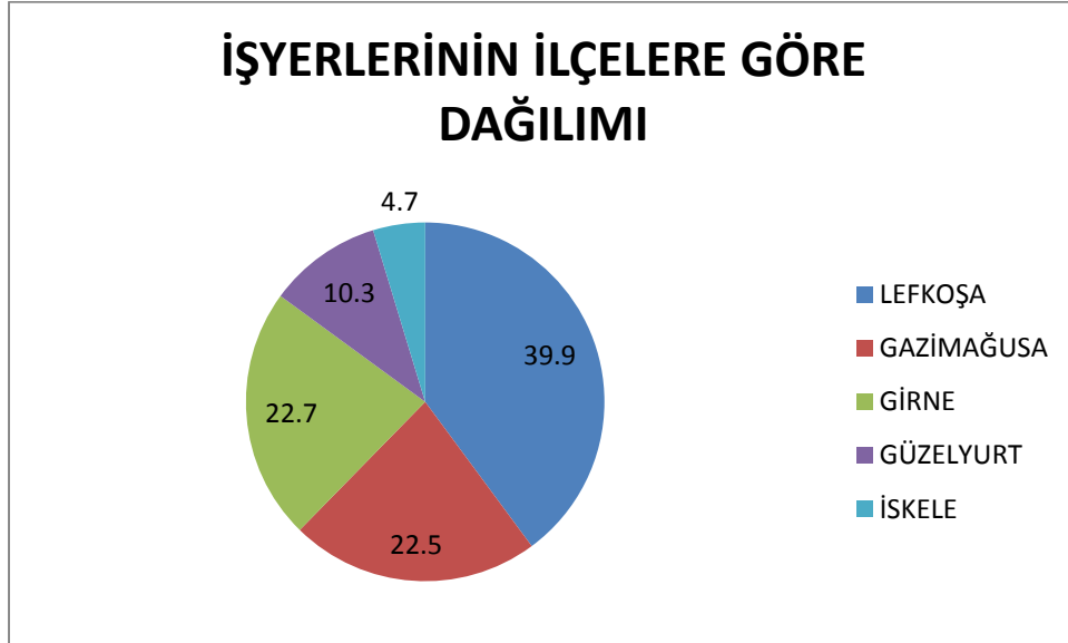
Grafik 1: İlçelere Göre İşyerlerinin % dağılımı

İşyerlerinin % 39,9'u, çalışanların ise % 49,5'i Lefkoşa'dadır. Bunu % 22,7 işyeri ve % 22,8 çalışan ile Girne ilçesi takip etmektedir.